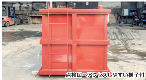
点検回へアクセスしやすい梯子付