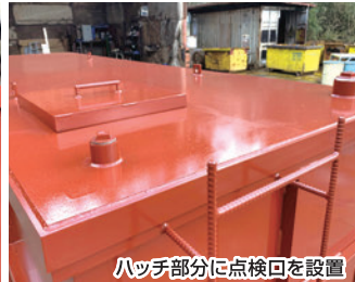
ハッチ部分に点検回を設置