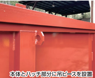
本体とハッチ部分に吊ビースを設置