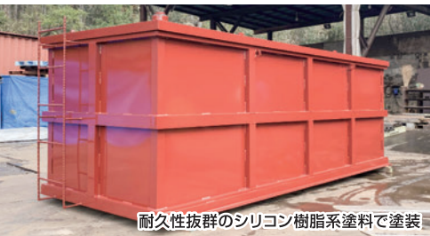
耐久性抜群のシリコン樹脂系塗料で塗装